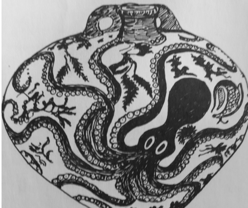
Resim 6: Ahtapot bezemeli vazo (Graham 1972).

Knossos'un ilk hafiri, yani ilk kazı çalışmalarını 1900 yılında başlatan İngiliz arkeolog Artur Evans ve diğer hafirler, sarayın tüm mimari parçalarını ortaya çıkardılar. Dört katlı sarayın kendisi ve ağaç gövdesinden yapılmış yivsiz sütunlar üzerine oturulmuş yatık merdivenleri, Girit mimarisinin ve mühendisliğinin başarı seviyesini gösterir. Giritli mimarlar, sarayın duvarlarını ahşap kirişler ve hatılardan oluşan iskelet sistemiyle inşa ettiler. Merdivenlerin basamakları için alçı taşı kullandılar. Girişleri (propilonları), sütunlu girişler (portikler), kapılı salonlar, lustrasyon (yıkama) havuzları, kutsal kült mekânları, karanlık odaları aydınlatan ışık delikleri ve depolar, çok odalı olan sarayların diğer mimari unsurlarıydı. Saray mimarisinin bir başka unsuru olan sütun başlıkları da sütunlar gibi ağaç gövdesinden yapılmışlardı ve bu başlıklar, daha sonraki Miken ve Dor sütun başlıklarının öncüleri oldular. Saray iç mekân duvarları ve zeminler alçı taşıyla kaplandı. Konusunu doğadan ve denizden alan resimler (Resim 6) ve en eski örneği Konya Ovası'ndaki Çatalhöyük'ten bilinen fresklerle süslendirildi. Ancak Giritliler, mühendislik başarılarını yalnızca saraylarda değil, saraylar için yaptıkları havalandırma bacalarında, lağım kanallarında, su yollarında ve açık hava tiyatrolarının yapımında da sergilediler.