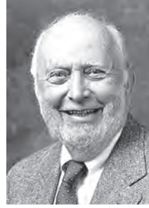
ŞEKİL 5. Douglass C. North (1920-2015).

bileşenlere sahipti ve her ikisi de açıkça ya da kapalı şekilde geçerlilik bakımından tarihsel kanıtlara dayanmaktadır. Michael Mann'ın Source of Social Power isimli eseri modern dönem öncesi Akdeniz tarihini kurumsal değişim teorisinin başlangıç noktası olarak kullanan önemli bir çalışmadır. 74 Bu yaklaşımlar belirli tarihsel ve sosyal bağlamlar içerisinde ekonomi kurumlarının işlevleri hakkında değerli bir bakış açısı sağlar. Bazı ilim insanları derin tarihsel gelişim üzerine odaklanmışken, ekonomik ve sosyolojik teoriyi kullanan çalışmaların çoğu bunu modern toplumların bağlamından türetmektedir. 75